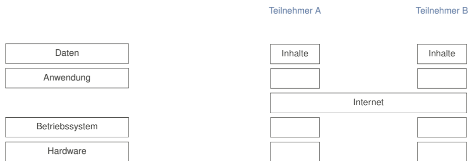
Abb. 2: Schichtarchitekturen eines typischen Einplatz-Rechners (links) und von Internet-Rechnern (rechts)

Berücksichtigung der Eingaben des Teilnehmers und der vom Netz empfangenen Nachrichten fortschreibt. Teilnehmer A hat keine wirksame Möglichkeit, den Zustand eines sicheren Endgeräts von Teilnehmer B gegen dessen Willen zu beeinflussen. 16 Zur Realisierung von dezentralen virtuellen Währungen ist diese Architektur nicht ausreichend, denn es gibt keinerlei Vorkehrungen, die einen konsistenten gemeinsamen Zustand zwischen allen Teilnehmern sichern. Dieser ist aber gerade notwendig, wenn es um die Verwaltung und Zuteilung von virtuellem Vermögen geht. Das Problem ließe sich umgehen, wenn alle Teilnehmer einem herausgehobenen Teilnehmer vertrauen und ihm die Verwaltung alleine überließe. Eine solche Rolle nehmen E-Geld-Institute nach 2000/46/EG ein. Sie stellen aber zentrale Parteien dar, die bei der Blockchain-Technologie vermieden werden sollen.